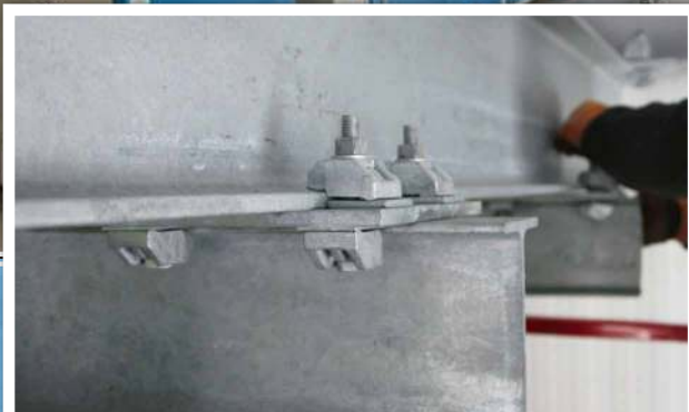
Les crapauds de fixation Type AF utilisés pour relier les poutres

Pour répondre à la hausse de la demande de services, Nor Tekstil a commandé une nouvelle usine de blanchisserie d'avant-garde, à Skedsmo au nord d'Oslo. Cette installation, la plus grande du genre en Norvège, est étudiée pour fournir une efficacité optimale. Le projet incorpore une ossature secondaire sous la structure principale du toit, pour suspendre et transporter les textiles à travers l'installation. Une solution d'assemblage capable de résister aux charges était donc requise.