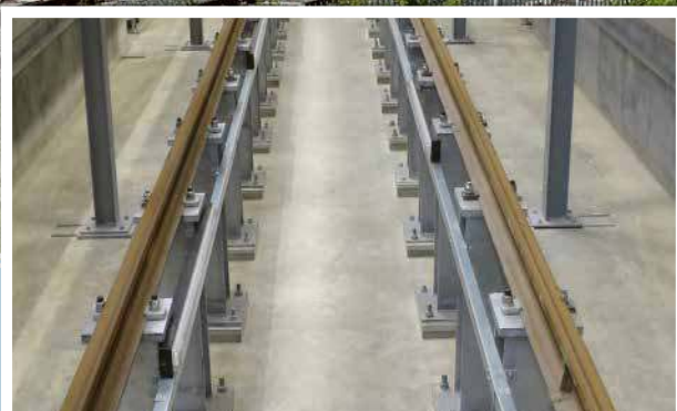
Les crapauds Type HD utilisés pour sécuriser les rails

Le long de chaque système « bogie drop », des plots métalliques sont boulonnés au sol en béton. Le défi consistait à trouver un moyen adapté pour relier des rails à fond plat aux plots métalliques, pour que les trains puissent rouler dessus en toute sécurité jusqu'à la zone « bogie drop », pour l'assemblage.