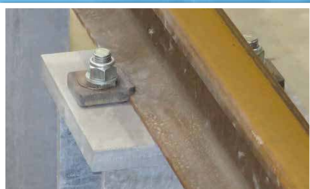
Les trains roulent sur les rails jusqu'à la zone d'assemblage