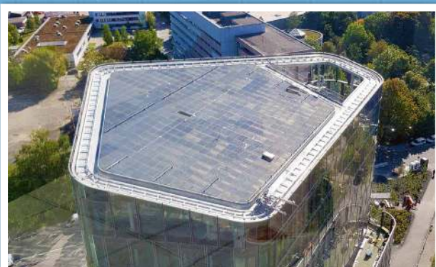
Les crapauds Type AAF ont permis d'éviter de percer le béton