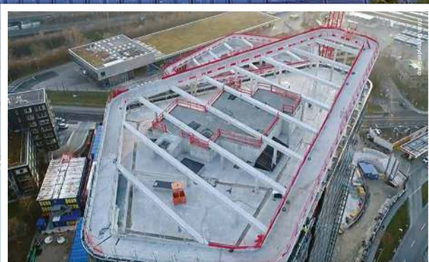
Les poutres en acier ont été fixées aux fermes en béton

Le toit incliné en béton s'élève au-dessus de piliers en béton et est relié par le biais de cadres supports formant une grille complexe qui contribue à renforcer l'ensemble. Les locaux techniques implantés dans l'espace sous la toiture hébergent les équipements de climatisation et de ventilation. Il fallait un moyen pour connecter les poutres métalliques aux fermes de la toiture en béton, sans percer, afin de construire les avant-toits qui couvrent et protègent les systèmes CVC.