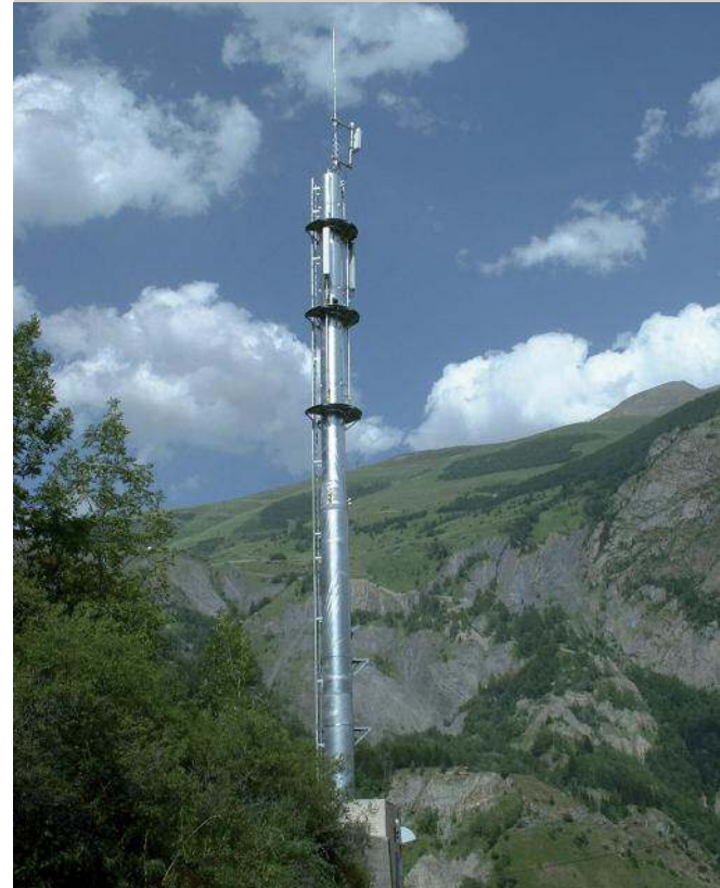
7.6-3 Application de produits galvanisés : antennes