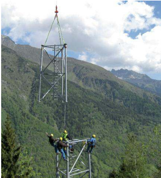
7.6-2 Application de produits galvanisés : pylônes

Avertissement : Pour les filetages M8 et M10, les charges d'épreuve et les contraintes sous charge d'épreuve des écrous ainsi que les charges ultimes en traction et les charges d'épreuve des vis et goujons sont spécifiées dans l'annexe A de la norme NF EN ISO 10684.